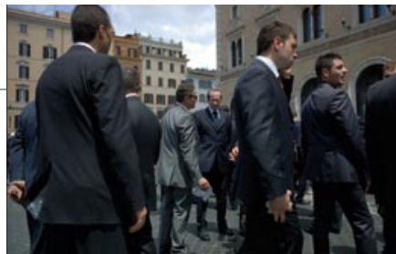
△ Tod Papageorge. Commissione Roma.

- Fotografie 1990-2010 , un progetto fotografico realizzato da Gianni Maffi. Una serie di immagini in bianco e nero stampate in maniera ineccepibile, vere e proprie