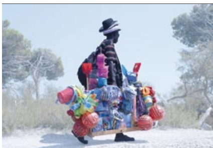
▲ Dalla mostra Ri-Africa .

Galleria Massimo Minini, via Apollonio 68, 25128 Brescia; tel. 030-383034; fax 030-392446; e-mail: valentina@galleriaminini.it ; internet: www.galleriaminini.it . Internet: www.museokendamy.com .