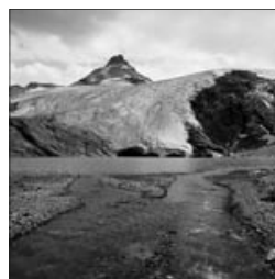
▲▲▲ Dalla mostra Aspetti del paesaggio naturale italiano - Fotografie 1990-2010